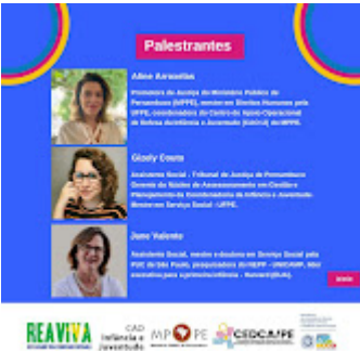
Card 4.jpg 125K