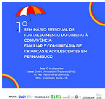
Card 1.jpg 97K