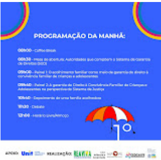
Card 2.jpg 98K