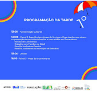
Card 3.jpg 87K